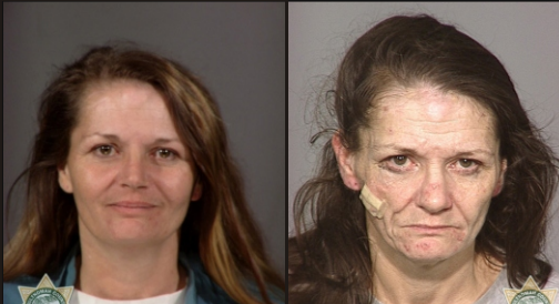
Rostros del Cristal 2005