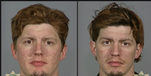
Rostros del Cristal 2005